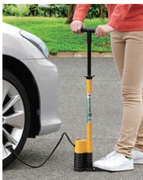
自動車タイヤ 使用イメージ