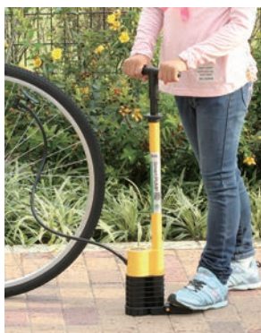
自転車タイヤ 使用イメージ