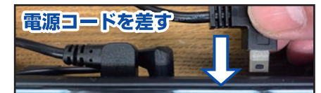
電源コードを差す