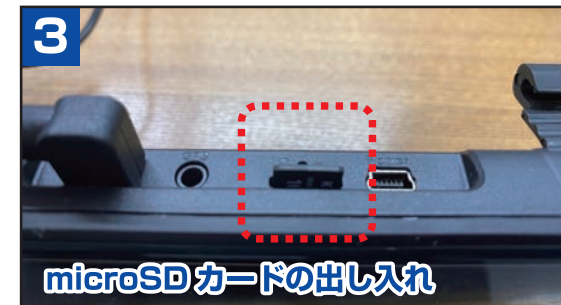
3 microSDカードの出し入れ

⚠️ 注意 GPSを差した状態でアップデートを行うと、正常にアップデートされず、電源が入らなくなる場合があります。この場合は当社にミラー本体をご送付いただき、有償修理となります。予めご了承ください。