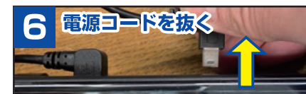
6 電源コードを抜く