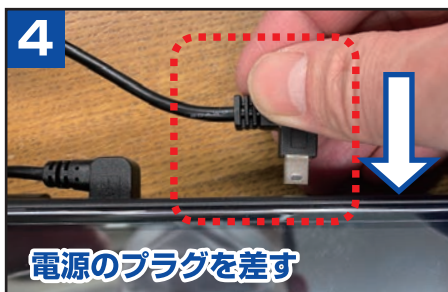
4 電源のプラグを差す